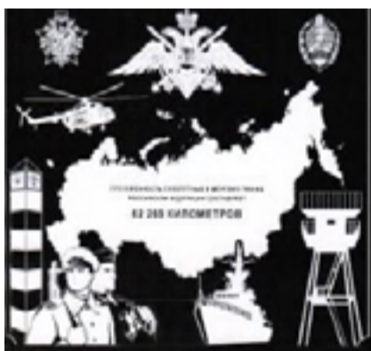
На рис.: один из четырех элементов стелы