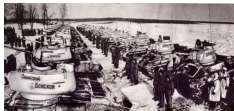
Танкисты боевой танковой колонны «Дмитрий Донской» готовы бить лютого врага.

Личный подвиг сочетался со сбором средств по приходам на нужды фронта. Первоначально верующие переводили деньги на счет Комитета Государственной обороны, Красного Креста и других фондов. Но 5 января 1943 г. митрополит