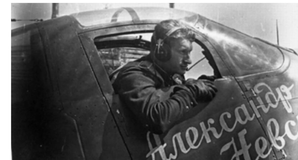
«От винта!» Истребитель боевой эскадрильи «Александр Невский» к вылету готов.