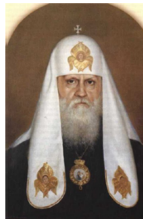
Ветеран Великой Отечественной войны, Патриарх Московский и всея Руси Пимен.

Он писал: «Победа достигается силой не одного оружия, а силой всеобщего подъема и могучей веры в победу, упованием на Бога, венчающего торжеством оружия правды, «спасающего» нас «от малодушия и от бури» (Пс.54:8). И само воинство наше сильно не одной численностью и мощностью оружия, в него переливается и зажигает сердца воинов тот дух единения и воодушевления, которым живет весь русский народ».