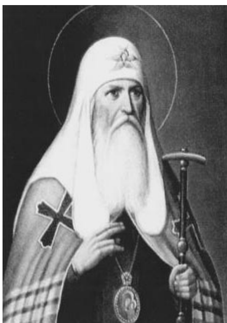
Гермоген, Патриарх Московский и всея Руси. 1530 - 17 февраля 1612 гг.

За годы Смуты многие, слишком многие русские люди потеряли способность отличать истинное от ложного, добро от зла, и все это время звучал одинокий обличающий голос святителя Гермогена, с 1606 года – Святейшего Патриарха. Его считали слишком суровым, даже жестким, но если непредвзято оценивать роль Патриарха в тех страшных и позорных событиях, выясняется интересная вещь: человек, когда-то благословивший народ новообретенным образом Казанской Божией Матери не совершил ни единой ошибки в оценке людей и ситуаций. Он единственный всегда точно знал, что делать, единственный не соблазнялся даже спасительными, на первый взгляд, компромиссами.