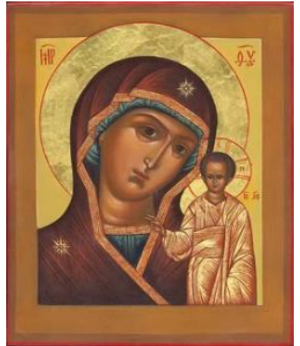
Пресвятая Богородица, спаси нас!