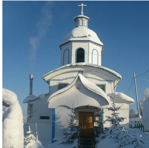
Лысьва, пос. Кормовище. Храм Святителя Стефана епископа Великопермского.

жией в добрых делах и благих начинаниях всем жителям Кормовищенской стороны,