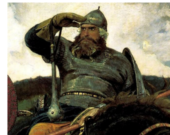
Илья Муромец в пограничном дозоре: «Не идет ли ворог лютый к русским рубежам?» Фотопортрет с картины Виктора Васнецова «Богатыри».

За свои средства в 1799 году построила первый на территории Лысьвы право-