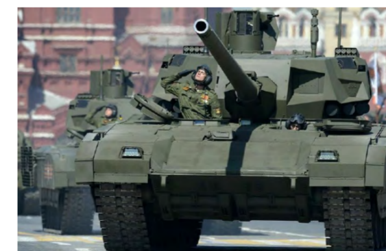
Москва. Парад в честь Дня Победы. На Красной площади современные российские танки Т-14 «Армата».

Опережаем раскрывших уже рты для критики «некоторых соотечественников» и подчеркнем: никто оружием не бряцает! Внешняя политика России направлена на мир во всем