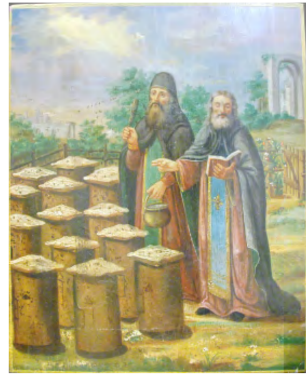
Пчельники Зосима и Савватий на молитве.

Зосима умер в 1478 году; канонизирован церковным собором 1547 года и тогда же ему была написана