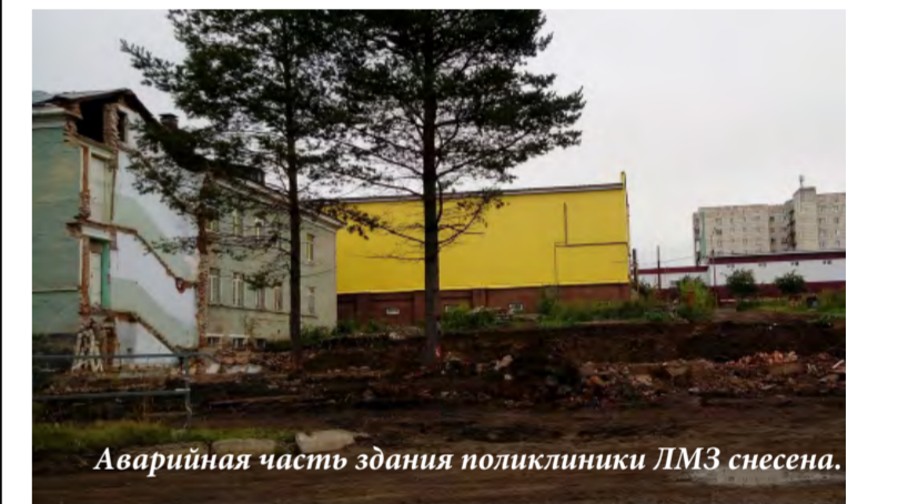
Аварийная часть здания поликлиники ЛМЗ снесена.

На этой строительной площадке - в месте стояния некогда аварийного здания поликлиники Лысьвенского металлургического завода - лысьвенцы также ежедневно наблюдают изменения.