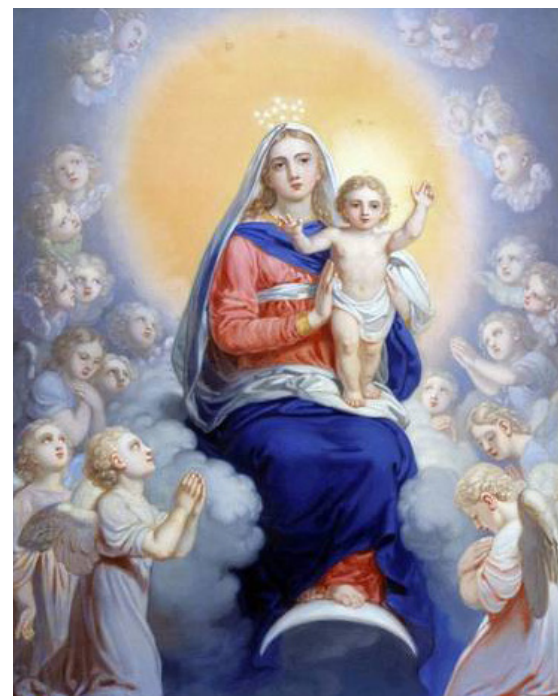
Богоматерь с младенцем в сонме ангелов. Боровиковский Владимир Лукич. 1823 г. Холст, масло.

Смерть не могла удержать Ее пречистого тела, просиявшего в жизни огнем страдания и ожившего после погребения апостолы, отвалив камень от по-