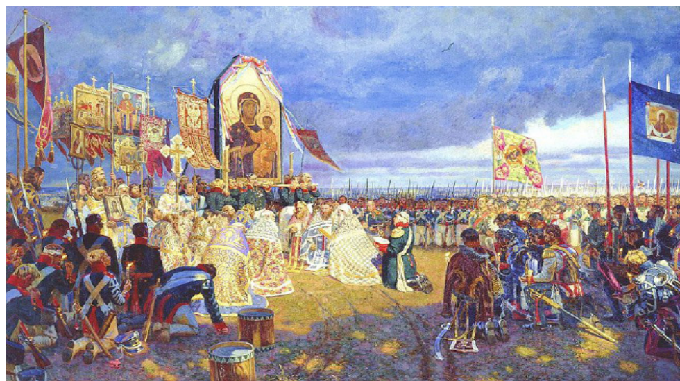
Молебен Пресвятой Богородице перед Бородинским сражением. Автор: член Союза художников России Егор Зайцев.

... Москва, спаленная пожаром, Французу отдана? Ведь были ж схватки боевые, Да, говорят, еще какие! Недаром помнит вся Россия Про день Бородина!