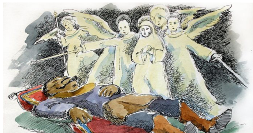
Явление Пресвятой Богородицы Тамерлану во сне.

образ — Владимирскую икону Божией Матери. И воскликнула: «Пресвятая Богородица, спаси нас!» В этот день Тамерлан задремал в своем шатре и увидел странный сон: на вершине горы стоит Жена в лучезарном сиянии, окруженная множеством воинов. Она грозно повелела захватчику убраться из России. Воины, окружавшие ее, молниями полетели на тирана. Тамерлан обратился к старцам, и те