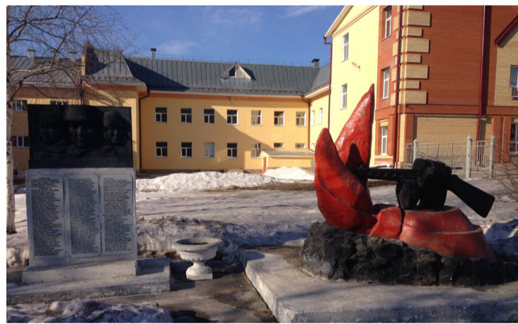
Лысьва. Памятник учащимся и учителям школы №3, погибшим на фронтах Великой Отечественной войны. Появился по инициативе выпускников 1950 года. На вечере встречи «20 лет спустя» те, кто в 41 учился во втором классе, решили увековечить память учеников и учителей, оставшихся на полях сражений. Изготовлен на средства выпускников школы №3. Автор Л. А. Кузнецова.

Это тонкое мастерство «подбирания ключиков» к нашим характерам доступно лишь им. С какой степенью похвалить или порицать, на уроке же или пригласив на «после уроков». А что у ребенка происходит дома, в порядке ли все?