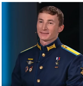
Выпускник лысьвенской школы №16 Герой России Павел Останин.