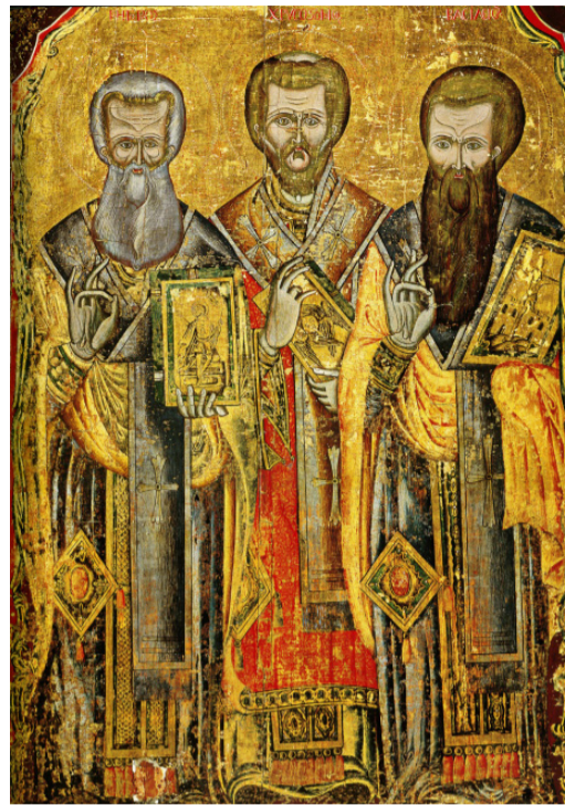
Святители Василий Великий, Григорий Богослов и Иоанн Златоуст.