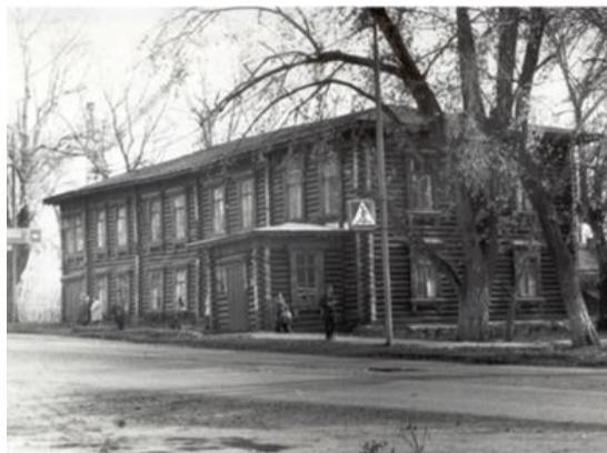
Лысьва. Деревянное здание прогимназии. После в нем находился Дом пионеров. Ныне здание не сохранилось. Сейчас на этом месте находится главное здание Сбербанка (ул. Мира).

Все знают, что слово «образование» происходит от церковнославянского слова «образ». И вот в этом мы видим глубокий промысел.