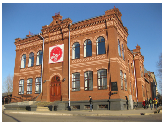
Лысьва. Историческое здание ремесленной школы – ныне Лысьвенского драматического театра. В годы Великой Отечественной войны от этого здания лысьвенцы отправлялись на ж/д вокзал и далее на фронты Родину защищать.