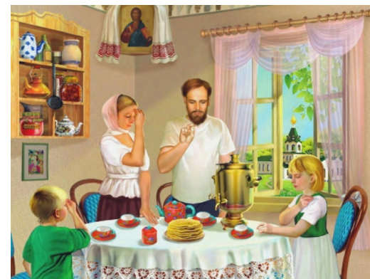
Благословенная Богом семья — самый первый институт для нравственного воспитания человека.

Само греческое слово «символ» имеет множество значений, оттенков, его можно перевести 29 различными способами, что показывает особые грани смыслов этого священного провозглашения веры. В древнейшем значении это слово обозначало разломанную надвое палочку или кольцо, половинки которого брали друзья или возлюбленные, расставаясь надолго. И когда проходило много лет, они узнавали друг друга, сложив символ воедино. Так же наш Вечный Друг и Жених Христос оставил нам эту веру — как половинку кольца, по которой Он опознает нас в День Своего возвращения. Ясно, что если мы потеряем свою половиночку, или хотя бы испортим ее так, что изменится место соединения, то узнавание при встрече не состоится. Христос скажет: «Я никогда