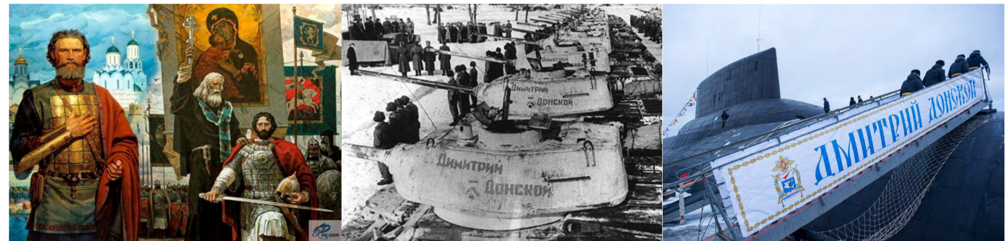
Фото факты. Это наша с тобой история

Благодарный великий князь Димитрий Донской родился в 1350 году, воспитывался под руководством святителя Алексия митрополита Московского и всея России чудотворца (в миру Елевферия). Христианское воспитание святого князя Димитрия сочеталось с его талантом выдающегося государственного деятеля. Он посвятил себя делу объединения русских земель и освобождению Руси от Ига. Собирая силы для решающего сражения с полчищами беклярибека* Мамай, св. Димитрий благословился у преподобного Сергия Радонежского. За победу на Куликовом поле (1380г.), находящимся между реками Доном и Непрядвой, князь Димитрий стал нарекаться Донским.