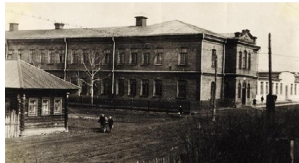
Школе №2 идет второй век. А так она возвышалась над деревянной Лысьвой 100 лет назад.