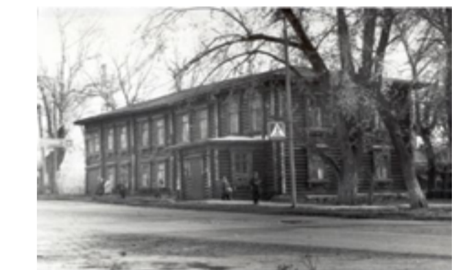
Деревянное здание прогимназии. После в нем находился Дом пионеров. Ныне здание не сохранилось. Сейчас на этом месте находится здание Сбербанка (ул. Мира).

Чтобы поступить в университет или институт, надо было закончить восьмой класс в гимназиях Перми или Екатеринбурга.