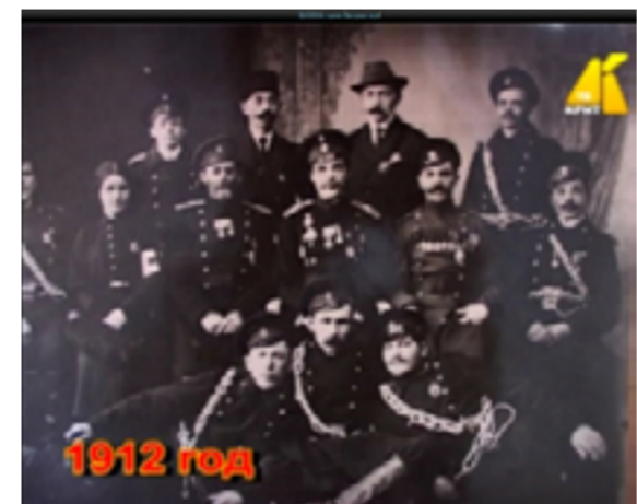
Вольно пожарное общество поселка Лысьвенский завод.

Позже, на Генеральном плане Лысьвенского завода от 1907 года отмечено пожарное депо. Тогда оно находилось на месте сегодняшней проходной №1 ПАО «ЛЭЗП» (из исследований О.П. Ананьина).