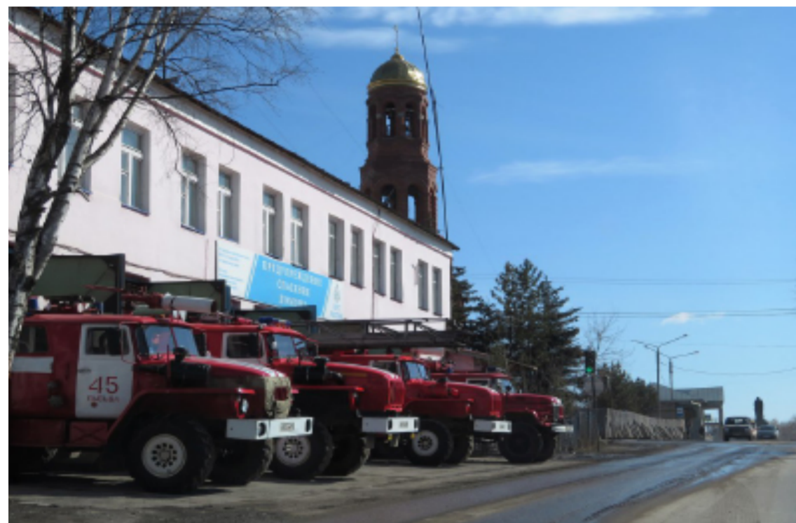
В любую минуту к бою готовы!

даже до крыши любой лысьвенской девятиэтажки.