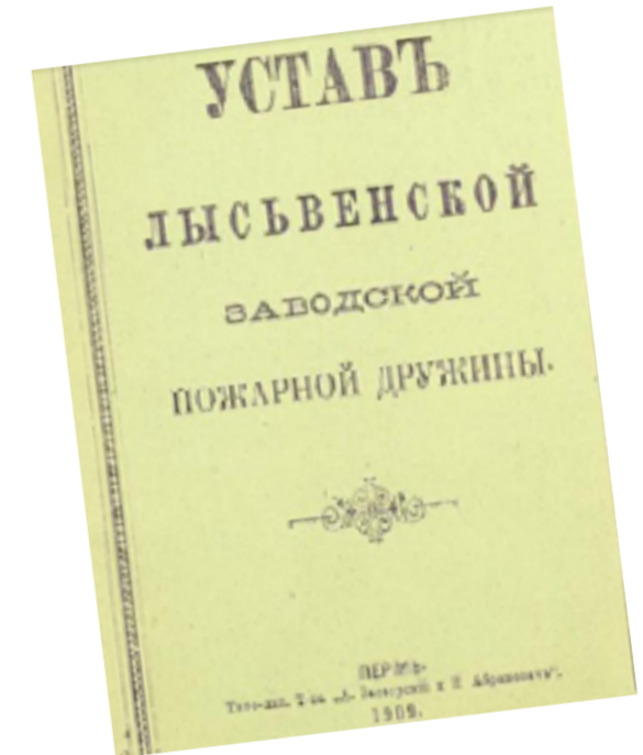
Устав Лысьвенской заводской пожарной дружины от 1909 года.

бодная площадь занималась огородом. При такой планировке имелась возможность поддерживать на улицах относительную чистоту, а что главное – это являлось мероприятием противопожарного порядка, что и оправдало себя в полной мере. Лысьва, как говорили, хотя и была деревянной, но на протяжении всего времени существования не знала таких пожаров, которые бы уничтожили более одной избы...».