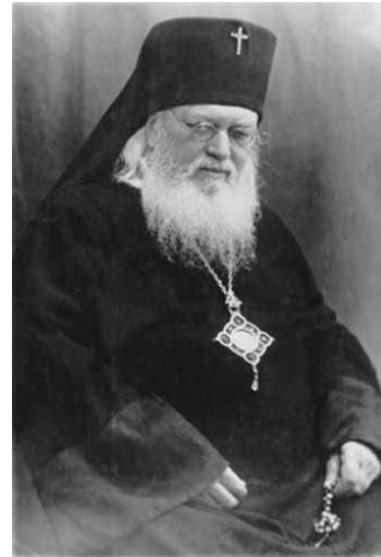
Святитель Лука Войно-Ясенецкий, ветеран тыла, лауреат Сталинской премии.

А кто отвергается Его Самого, тот отвергается Пославшего Его. Нет более тяжкого греха, чем расколы и разделение Церкви Христовой. Так говорили все великие святители, так говорил Иоанн Златоуст, Василий Великий, почти теми же словами, которыми сказал священномученик Киприан: «Люди, не хранящие союза и искреннего общения с Церковью, хотя бы предали себя смерти за исповедание имени Христова, грех их не омоет и самую кровь; неизгладимая и тяжкая вина разделения не очищается даже кровию». Видите, какой ужасный грех раскол и сектантство, как страшно уклоняться от Церкви Христовой и идти за еретиками. Святые апостолы многократно предупреждали нас об этом. В послании к римлянам апостол Павел говорит: « Умоляю вас, бра-