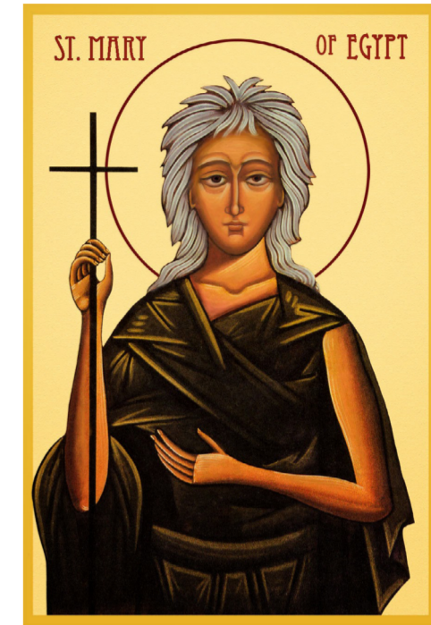
Святая преподобная Мария Египетская считается покровительницей кающихся женщин. Память совершается в Православной церкви 14 апреля и в пятую неделю Великого поста.

лодку, она переправилась на другой берег. Перед ней была безлюдная пустыня. Затем она скрылась от человеческих глаз... Старое платье, да два с половиной хлеба в руках... Преображение Господь, выведший Марию Египетскую из мира, устроил и то, что старец, монах Зосима, удалившийся на время Великого поста в заиорданскую пустыню, стал изумлённым свидетелем её подвига.