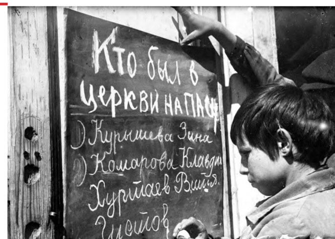
30-е годы прошлого века. На «доску позора» записывают фамилии тех, кто был в храме на Пасху.

Да разве можно преувеличить значение этих женщин, которые снова и снова под пристальным взглядом гонителей и хулителей, шли в храм, чтобы молитвенно воздохнуть о своих сыновьях, мужьях, братьях, слишком занятых строительством светлого и неотвратимого будущего.