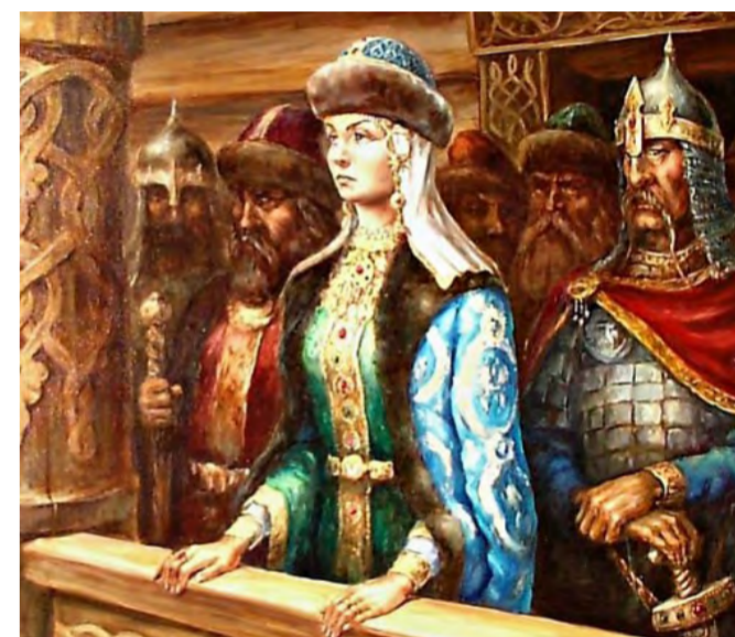
Святая равноапостольная княгиня Ольга.

Святая блаженная Ксения Петербургская, одна из любимейших русских святых жен XIX века, канонизирована сравнительно недавно – в 1988 году за подвиги юродства. Жизнь ее протекала во времена царствования Ели-