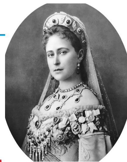
Портрет Великой Княгини Елизаветы, 1896 год.

Именно русская женщина - есть основная опора в духовном возрождении нашего Отечества. Русская жена всегда была верна, тиха, милосердна, кротко терпелива, всепрощающа, в то же время, русская женщина всегда была готова совершить подвиг, пострадать за ближних и за свое Отечество.