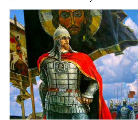
История отечественного флага берёт начало с 1380 года, когда князь Димитрий Донской выступил против Мамаея под знаменем черного цвета.

новение убиенных воинов и повелел делать это и впредь. Так были установлены Димитриевские родительские субботы. Последние годы жизни великого князя Димитрия Иоанновича были, вероятно, самыми трудными для него; после Куликовской битвы его ждали многие тяжелые испытания. Осенью 1380 года,