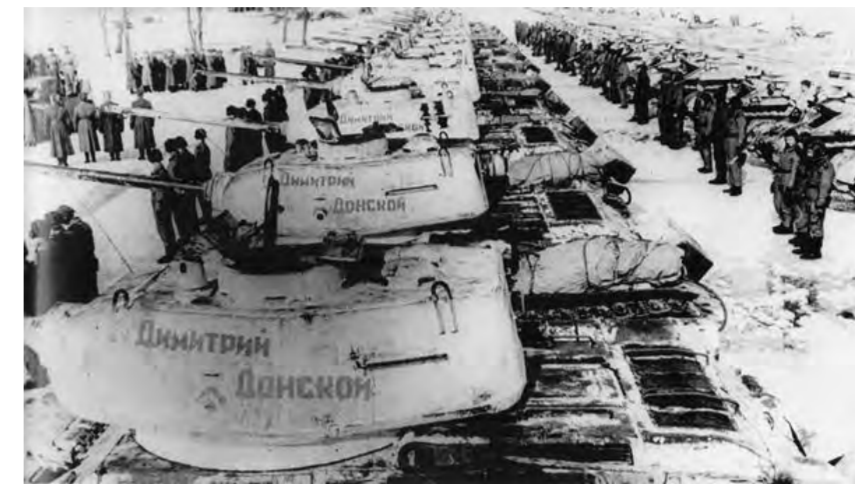
Великая Отечественная война. Русская Православная Церковь передает нашей армии танковую колонну «Димитрий Донской». Танковая колонна была построена на средства православных христиан (в том числе проживающих и на оккупированной территории).