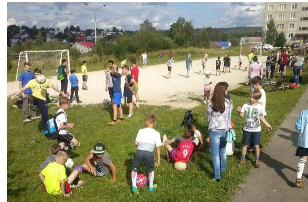
Лысьва, двор дома по ул. Ленина, д. 51. И стар и млад участвуют в дворовых соревнованиях «Здоровый двор», организуемых общественниками города.

Нужен, потому что они люди. И им тоже нужны здоровые дети, полезно занятые и не