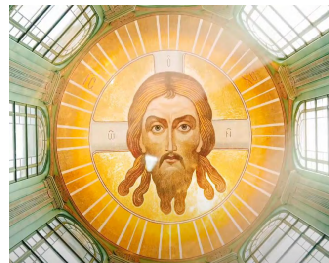
Под куполом Главного храма Вооруженных сил России.

цифра тоже не случайна – в 2020 году исполнится ровно 75 лет со дня победы; Высота малого купола составляет 14,18 м. И эта цифра символична – долгих 1418 дней шла война. 4 придела собора символично посвящены святым-покровителям войск российской армии: Придел Св.Илии Пророка (который является покровителем Воздушно-космических и Воздушно-десантных войск РФ);