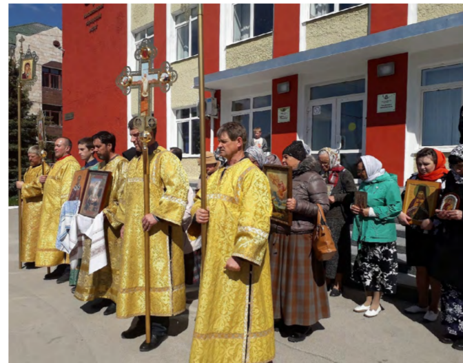
Лысьва. 22 мая 2019 года. Крестный ход по улицам города в честь Святого Николая Чудотворца. Остановка на молебне у администрации Лысьвы.

ского, Николай Чудотворец являлся к людям, обремененным различными бедствиями, подавал им помощь и спасал их от смерти: «Своими делами и добродетельной жизнью святитель Николай сиял в Мирах, как звезда утренняя среди облаков, как месяц красивый в полнолунии своем. Для Церкви Христовой он был ярко сияющим солнцем, украшал Ее, как лилия при источнике, был для у Нее миром благоуханным!» До глубокой старости сподобил Господь дожить Своего великого Угодника. Но наступило время, когда и он должен был отдать общий долг человеческого естества. Николай Чудотворец мирно отошел ко Господу 6 декабря (19 декабря по н.ст.) 342 года и был погребен в соборной церкви города Мир.