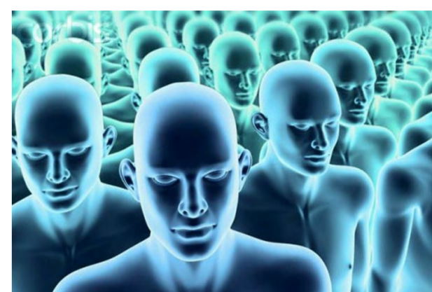
Люди-роботы. Люди с чипами... Куда ведут человечество?

И священник, и психолог, и психотерапевт должны каждый заниматься своим делом, а сообща — помогать человеку. Успех их взаимного действия зависит, в том числе, от распространения того духовного опыта, которым обладает Православная Церковь, но с