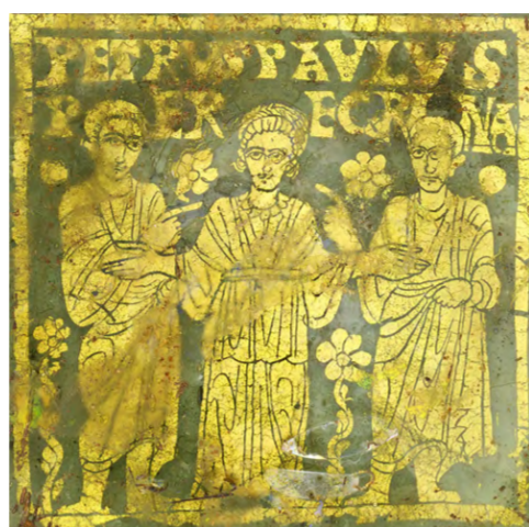
Апостолы Петр и Павел, святая Перегринна. Изображение золотом на дощечке стеклянной чаши. Рим, середина IV века, Метрополитен-музей в Нью-Йорке (фрагмент).

бо, быв напоены Божественными водами, мы не должны покорствовать никаким вожелениям, не должны служить никаким порокам, чтобы жилище добродетели не оквернилось ничем нечестивым. При помощи и содействии Божиим мы все можем достигнуть этого, если только, очищая себя постом и милостыней, будем стараться освободить себя от скверн греховных и приносить обильные плоды любви». Далее св. Лев Римский пишет: «Из апостольских правил, которые внушил Сам Бог, первостоятели церковные, по внушению Святого Духа, первым поставили то, чтобы все подвиги добродетели начинать с поста. Это они сделали потому, что заповеди Божьи можно исполнить хорошо только тогда, когда воинство Христово ограждено от всех соблазнов греха святым воздержанием. Итак, возлюбленные, должны мы упражняться в посте преимуще-