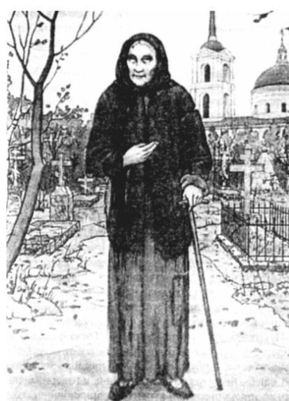
По материалам православных СМИ

сражениях парусных судов имели первостепенное значение), он заставил корабли противника сбиться в кучу. Пушечным огнём турецкие корабли были сильно повреждены и после нескольких часов перестрелки бросились в бегство. Султан Селим услышал роковые для себя слова «Великий, твоего флота больше нет». Православным часто бросают упрёк в том, что они прибегают к молитве вместо решительных