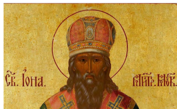
Митрополит Иона. Фрагмент иконы.

Несколько лет спустя, при постройке нового кафедрального