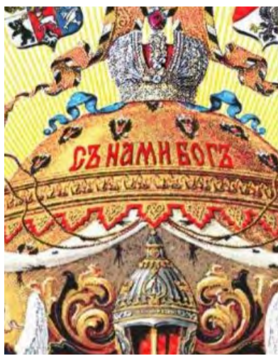
Фрагмент Большого Государственно-го Герба Российской империи (1882г.). В центре герба червлёная надпись: «Съ Нами Богъ!».

Украиной - странами, имеющими общие корни и родство. Вы знаете, что в наши дни некие известные всему миру дирижеры умышленно продолжают пытаться «вбить клин» между российскими и украинскими народами. Для достижения своих целей они задействовали весь арсенал своих средств, включая оружие.