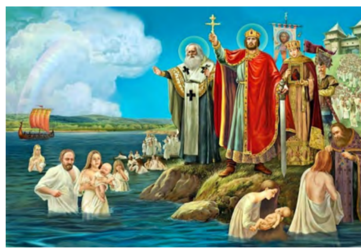
X век. Крещение Руси.

гельской истины. След за этим митрополит Михаил, при содействии равноапостольного князя, начал насаждать по горо-