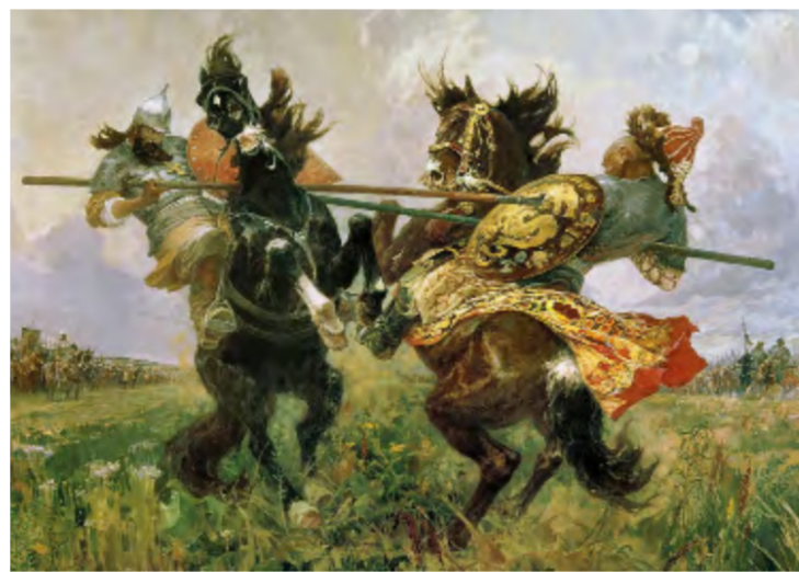
Слава великой Руси богатырской! Легендарный поединок Пересвета с Челубеем. Россия, Куликовская битва, сентябрь 1380 года.