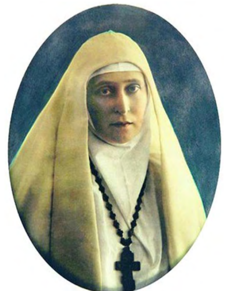
Великая княгиня Елисавета Феодоровна (53 года).