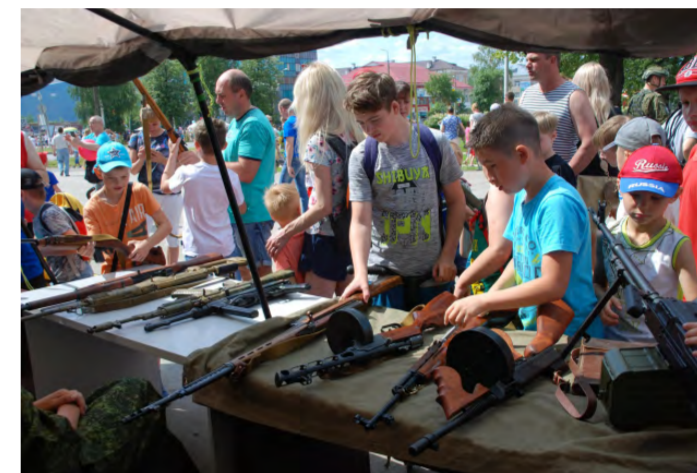
Лысьва, День города. У патристического павильона, традиционно организуемого Комитетом ветеранов боевых действий на Северном Кавказе, всегда многолюдно. Мальчишки, девчонки да и взрослые с интересом рассматривают экспонаты стрелкового оружия времен Великой Отечественной войны.

ности, с любовью взирает на труды наши и поощряет к ним разным образом.