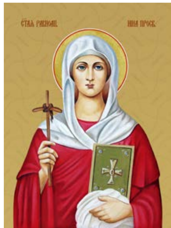
Равноапостольная Нина, просветительница Грузии

Слова Божия служительнице, во апостольстей проповеди первозванному Андрею и прочим апостолом подражавшая, просветительнице Иверии и Духа Святаго цевнице, святая равноапостольная Нино, моли Христа Бога спастися душам нашим.