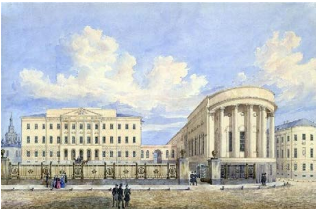
Новое здание Московского университета на Моховой с церковью св. Татианы. Г.Ф.Барановский. 1848 г.

Новый домовый храм Московского университета был перестроен в 1833 – 1836 гг. из правого флигеля усадьбы Пашковых на углу Никитской и Моховой улиц известным архитектором Евграфом Дмитриевичем Тюриным и освящен 12 января (25 января) 1837 году митрополитом Филаретом (Дроздовым) в честь мученицы Татианы. Примерно с того времени и пошла традиция устраивать в Татьянин день студенческие гуляния, а саму святую почитать как покровительницу студентов. На аттике, красуется надпись «Свет Христов просвещает всех».