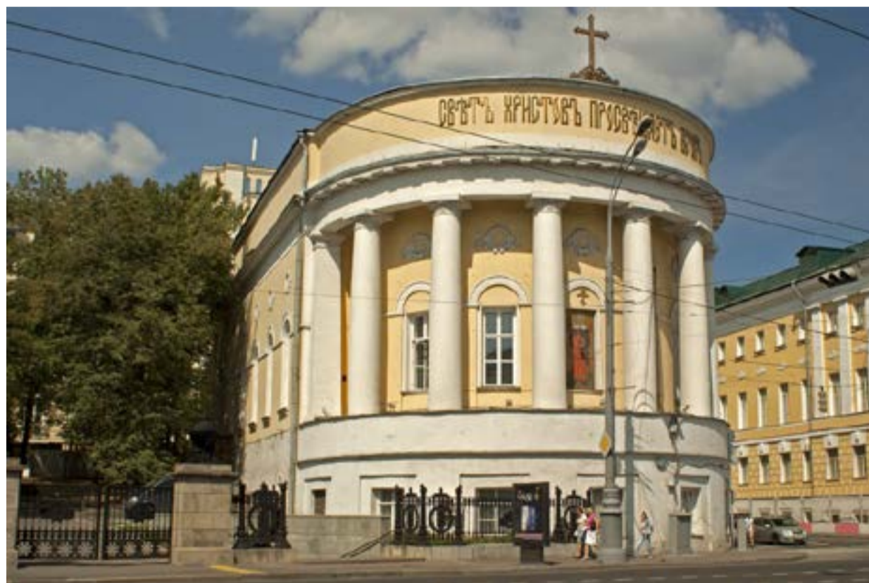
Храм святой Татианы при МГУ (Москва)